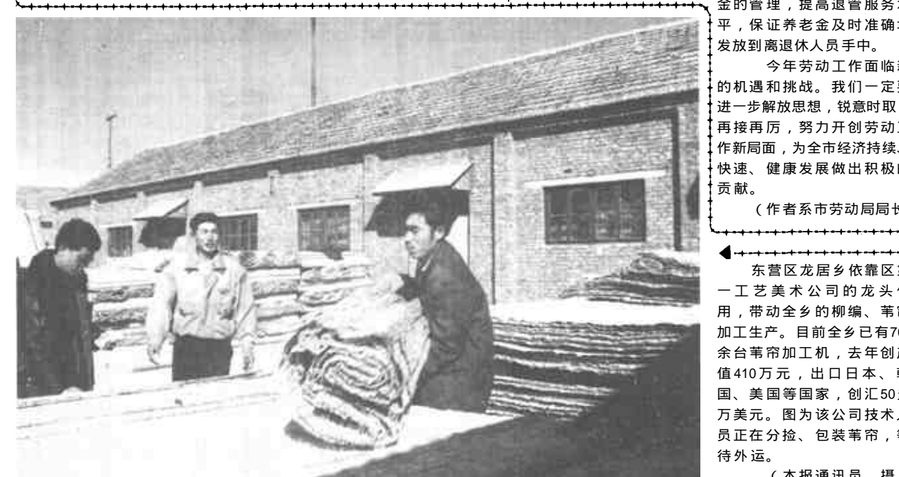
东营区龙居乡依靠区第一工艺美术公司的龙头作用，带动全乡的柳编、苇帘加工生产。目前全乡已有700余台苇帘加工机，去年年产值410万元，出口日本、韩国、美国等国家，创汇50多万美元。图为该公司技术人员正在分检、包装苇帘，等待外运。

利津讯 利津县高度重视油区治安综合治理工作，积极发挥专职队伍的维护职能，全县上下齐心协力，遏制各类违法犯罪活动，创造了油区治理的良好局面。 利津县境内共有油井3000多口，近年来，随着油田的不断开发建设，油区面积越来越大，给社会治安管理带来了很大的难度和工作量。为确保油区稳定，全县各级领导高度重视油区社会治安综合治理工作，上下坚持“打防并举，标本兼治”和“油区治安重中之重”的方针，确保了油区秩序稳定。这个县各级党委、政府对油区社会治安综合治理工作高度重视。县委常委多次召开会议，研究部署油区治安综合治理工作，县委与县直单位和各乡镇、镇乡又与各村、各村又与各村层层签订了责任书。对综合治理责任实行综合考核，坚持一票否决制度，使全县上下形成了一级抓一级，一级对一级负责的新格局。在此基础上，这个县还先后组织280余辆宣传车，出动宣传队伍1801人次，开展大型油区治安宣传4次，发放材料2850余份，标语5460余幅，油区受教育群众达91000多人。 去年以来，这个县有针对性地开展了以油区水电气管理为重点的综合治理，各乡镇的区域治理和专项治理达26次，共取缔高耗能农户小炼油5处，私接天然气、水管线53处，公安部门抓获盗窃油田物资的犯罪分子124名。使油区的案件大幅度下降。去年，全县涉油刑事案件发生6起，没有发生重大案件；治安案件5起，与上年相比，分别下降64.7%，100%和44%。（韩宁 张林渠）