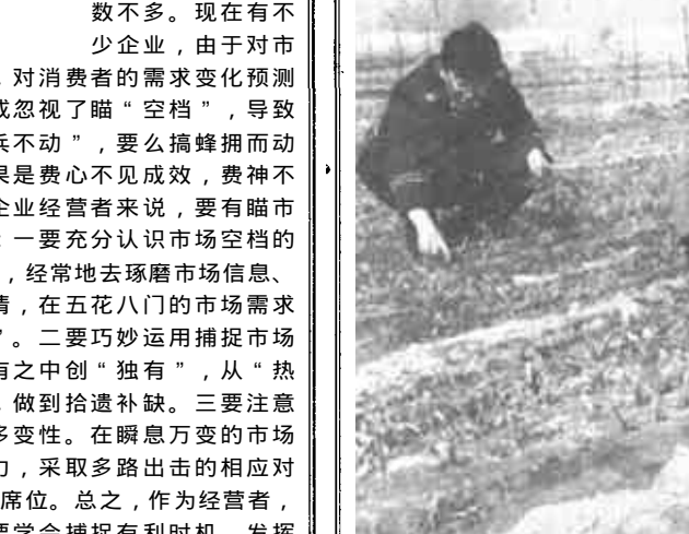
东营区油郭乡大力调整农业产业结构，在油麻路南建起了3000亩的果园。蒜苗返青之际，该县及时引导群众进行田间管理。

广饶讯 广饶县把春季植树造林工作作为一项重要工作来抓，全县上阵劳力先后已达8300人，创坑96360个，植树5300余株。 具体工作中，他们重点采取六项措施：一是抓好高标准农田林网建设。并灌区各乡镇重点做好林网的完善工作，消除断带，规范网络标准；黄灌区各乡镇重点做好原有和新建农田林网的补植工作。 二是抓好路域绿化工程。干线公路两侧除水面和固定建筑物外，林带不留断带，不留空档；林网建设提高档次和标准，形成林网示范区。县、乡公路防护林带在去年大力实施建设的基础上，今春全面完成种植任务。 三是抓好农业开发区的林网配套。因地制宜，适地适树，实行多树种造林，使农业开发区成为高标准、高科技含量的农田林网区。 四是抓好黄灌区的枣粮间作。重点在西刘桥、大营、大码头和丁庄四乡镇实施枣粮间作，完成市政府下达今春完成3万亩的生产任务。 五是抓好好村庄绿化活动。按照街道绿化、村庄森林化、庭院宅旁绿化加美化的标准，使村庄林木覆盖率达到30%以上。 六是抓好育苗基地建设。建立优质苗木基地200亩，实现基地育苗、定向培育、包育包销一体化。（赵军元 李在峰）